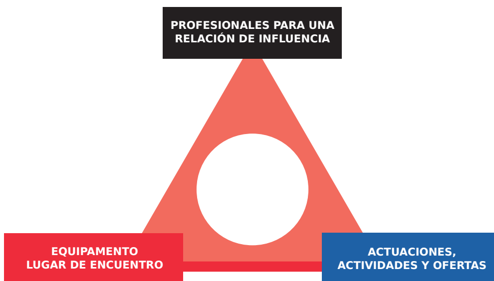
Gráfico 1 LAS TRES DIMENSIONES DEL SPA

El Servicio Polivalente para Adolescentes debe tener siempre componentes de las tres dimensiones, como se indica en el siguiente gráfico: